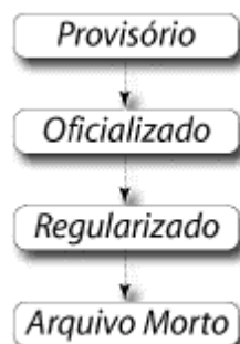
Figura 3: A vida de um contrato ou de um aditamento.

projetos de rápido retorno econômico- financeiro. Assim, as fases anteriores ao contrato propriamente dito, também merecem uma administração por parte do SC – Sistema Contratos (figura 3).